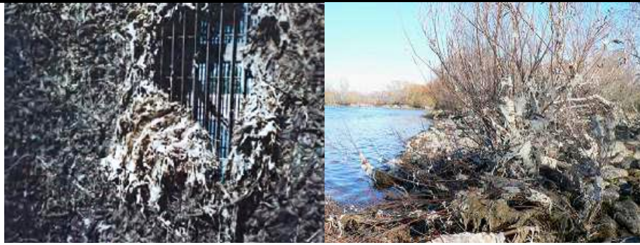
Fig. 3. Derecha: obstrucción en rejilla de un canal de agua en California (Spaulding y Elwell, 2007). Izquierda: aspecto de las colonias secas sobre rocas y vegetación riparia en el río Hawea, Nueva Zelanda (MAF Biosecurity New Zealand web site).