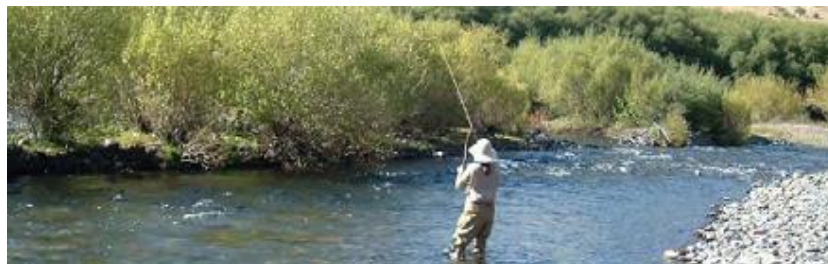
Fig. 4. El incremento en el número de pescadores originarios de Estados Unidos (posibles dispersantes de D. geminata ) que visitan distintas partes del mundo es ilustrado en el trabajo de Spaulding mediante una foto de un pescador en el río Malleo, Provincia del Neuquén (Spaulding y Elwell, 2007).

Los múltiples destinos y largas distancias que recorren (en corto tiempo) los pescadores los hacen buenos candidatos para la dispersión de D. geminata (Fig. 4). Por otra parte todo equipamiento utilizado en otras actividades acuáticas recreativas (kayak, rafting, jet ski, buceo, etc.) es indicado como potencial vector de D. geminata .