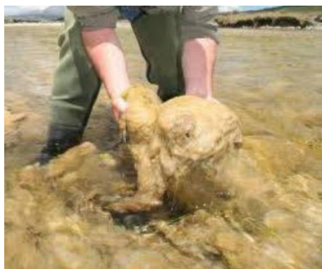
Fig. 2. Aspecto de las proliferaciones masivas en ríos de Nueva Zelanda.

crecimientos en áreas donde previamente existían en bajas concentraciones (Kilroy, 2004). Proliferaciones masivas han sido reportadas en Canadá, Estados Unidos, distintos países de Europa y se destaca a Nueva Zelanda como el país más recientemente afectado.