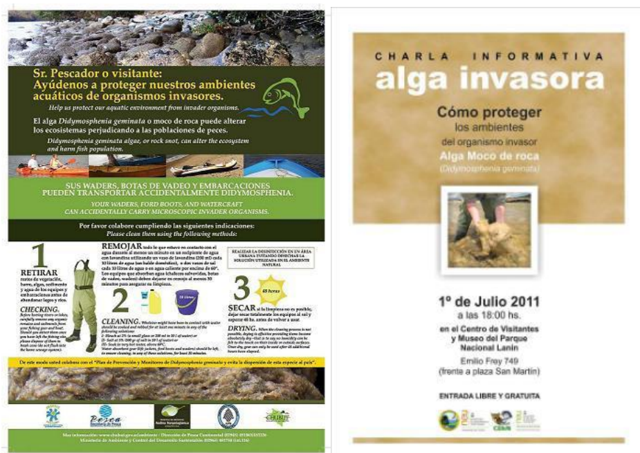
Fig. 6. Derecha: afiche utilizado para la campaña de difusión. Izquierda: afiche de difusión de charlas informativas.

Por otra parte, particularmente en la Provincia del Neuquén se está desarrollado una campaña de difusión: desde el CEAN, APN y DGBA se organizaron charlas informativas destinadas a prestadores turísticos y público en general con el fin de concientizar a la población de la problemática y difundir medidas de prevención y desinfección. Esta actividad fue acompañada por la impresión y distribución de afiches y folletería en oficinas de turismo, alojamientos y agencias de prestadores turísticos (Fig. 6).