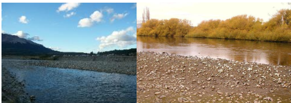
Fig. 5. Ríos Pampa (derecha) y Futaleufú (izquierda) donde se detectó la presencia de D. geminata .

En agosto-septiembre de 2010 Sastre et al. detectan por primera vez en nuestro país la presencia de D. geminata en aguas del río Futaleufú, Provincia del Chubut. D. geminata fue encontrada formando floraciones mixtas con otras diatomeas nativas y también en forma libre. Posteriormente la distribución del Didymo se amplió hacia el sur, al ser detectada en el río Pampa (Sastre et al. 2011) (Fig. 5).